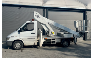
Model: WUMAG WT200

Wys. robocza: 20 m Maks. wychylenie boczne: 9,5 m