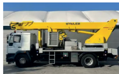
Model: Wumag WT355

Wys. robocza: 24 m Maks. wychylenie boczne: 12 m