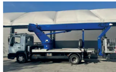
Model: Wumag WT300

Wys. robocza: 22 m Maks. wychylenie boczne: 14 m