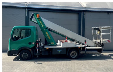
Model: Palfinger P260B

Wys. robocza: 35,5 m Maks. wychylenie boczne: 25m