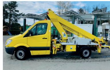
Model: Ruthmann TB220.2

Wys. robocza: 27 m Maks. wychylenie boczne: 20,5 m