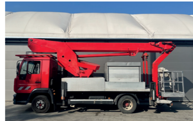
Model: Ruthmann T270

Wys. robocza: 20 m Maks. wychylenie boczne: 9,5 m