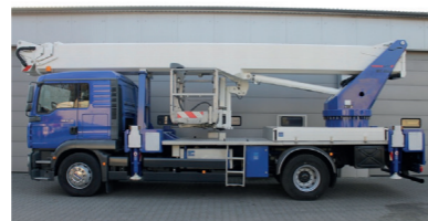
Model: Wumag WT450

Wys. robocza: 26,5 m Maks. wychylenie boczne: 13,8 m